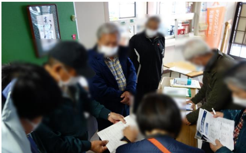
避難者名簿による要配慮者の把握の様子