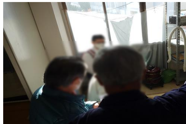
要配慮者への声掛けの様子 （左：熊野東防災交流センター、右：中通地域交流センター）