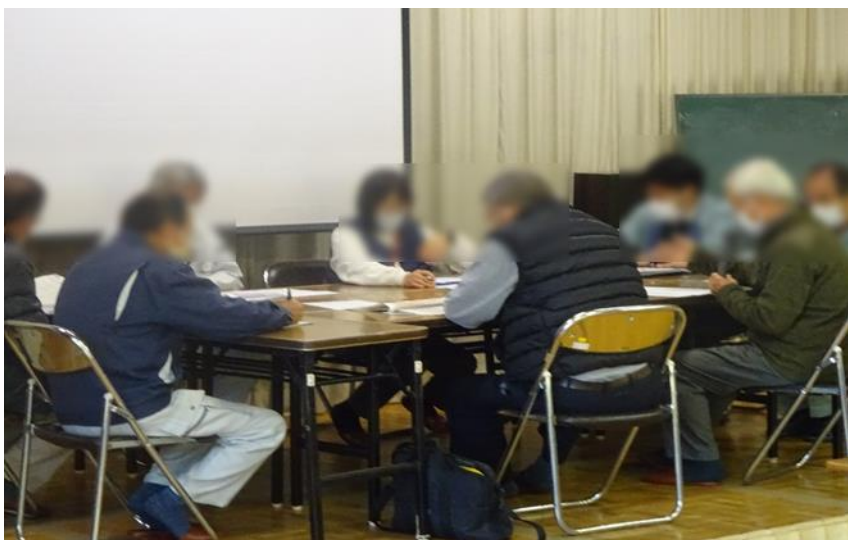
避難所運営会議の様子