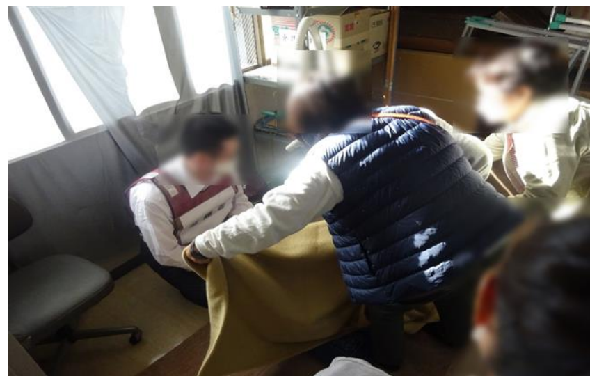
避難者対応の様子