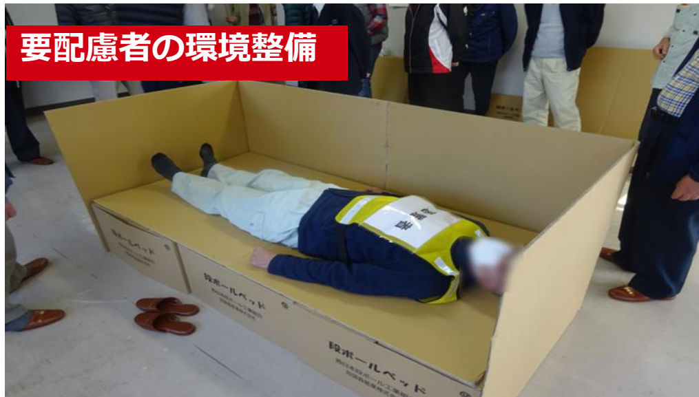
要配慮者対応の訓練の様子（中通地域交流センター）