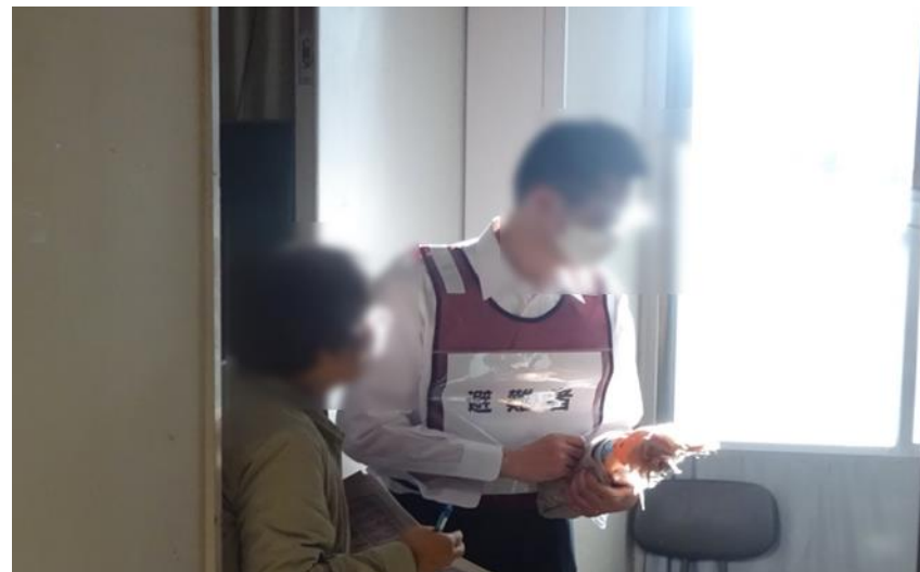
要配慮者への聞き取りの様子