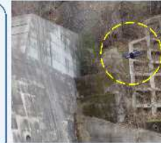
ドローンによる撮影状況