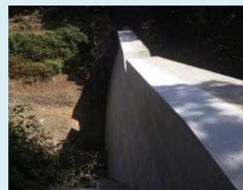
R4年度修繕事例（尾道市瀬戸田町）

◆引き続き、健全度Eの施設について速やかに対策を実施します。 点検の結果新たに緊急に対策が必要な施設が見つかった場合は、速やかに対策を実施します。