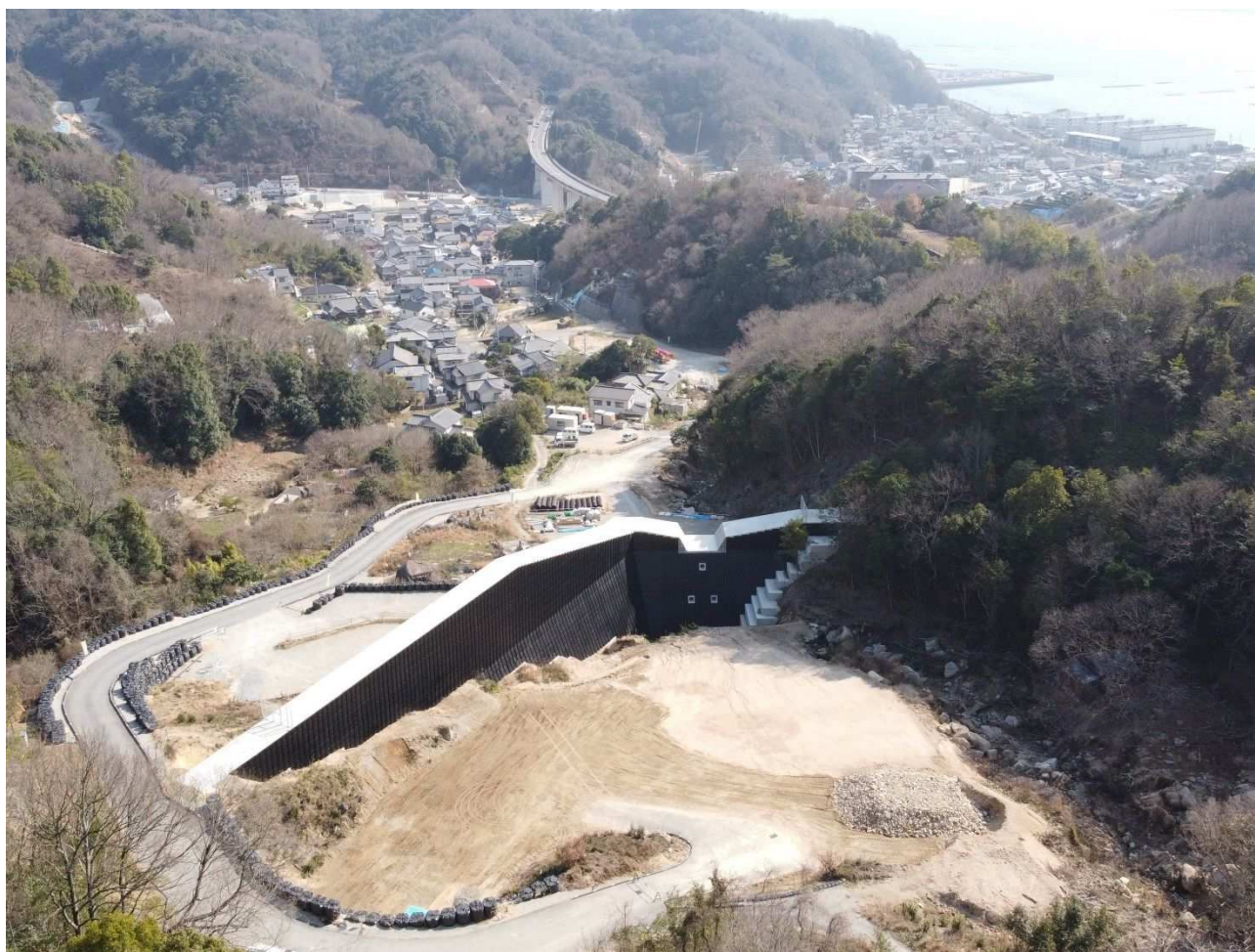
平成 30 年 7 月豪雨に対する土砂災害対策（坂町小屋浦）