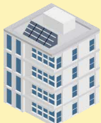
後期高齢者医療広域連合