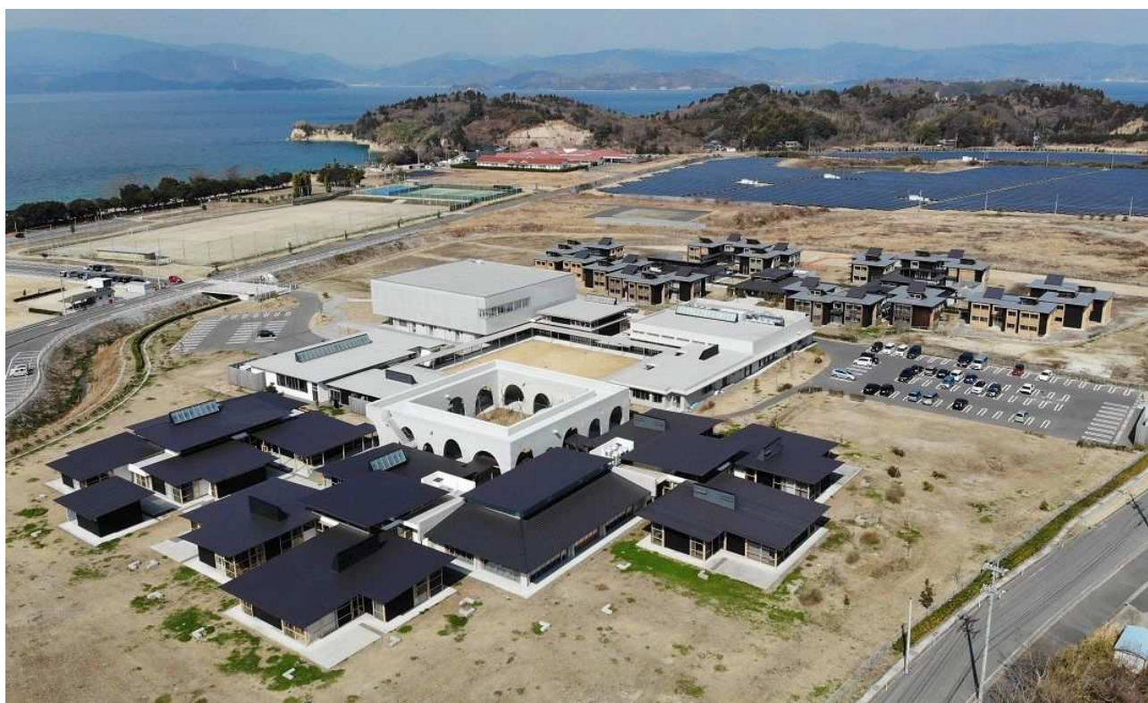
広島県立広島叡智学園中学校・高等学校 完成後全景