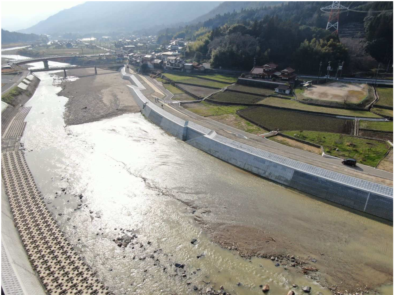
災害復旧助成事業 一級河川太田川水系 三篠川 (広島市安佐北区)