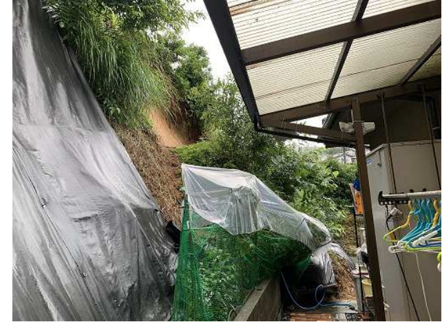
斜面崩壊・被災状況（令和2年7月）