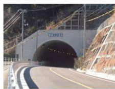
道路改良工事例 (バイパス整備)