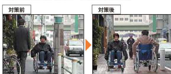
移動円滑化を妨げる電柱