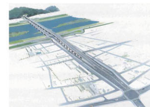
福山沼隈道路 整備イメージ