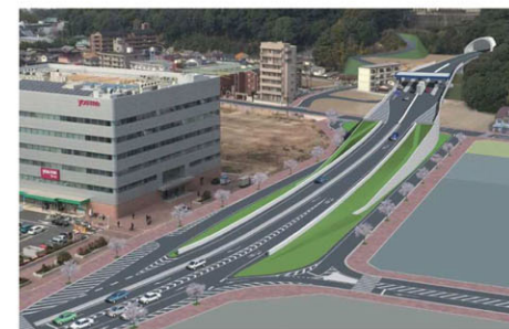
広島高速5号線広島駅北口出入路（仮称） 整備イメージ