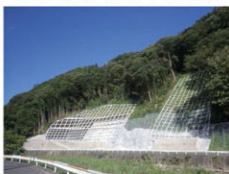
法面災害防止工事例 (法枠工事)