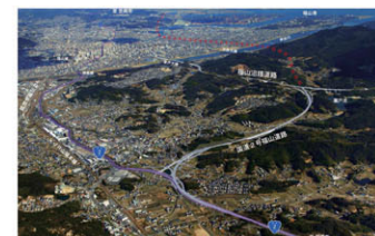
一般国道2号福山道路