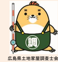
広島県土地家屋調査士会 マスコットキャラクター「しらべ君」

土地家屋調査士は、土地の境界、建物の所在や形状、用途を調査測量し、図面作成、法務局への申請手続などを行う測量及び登記の専門家です。