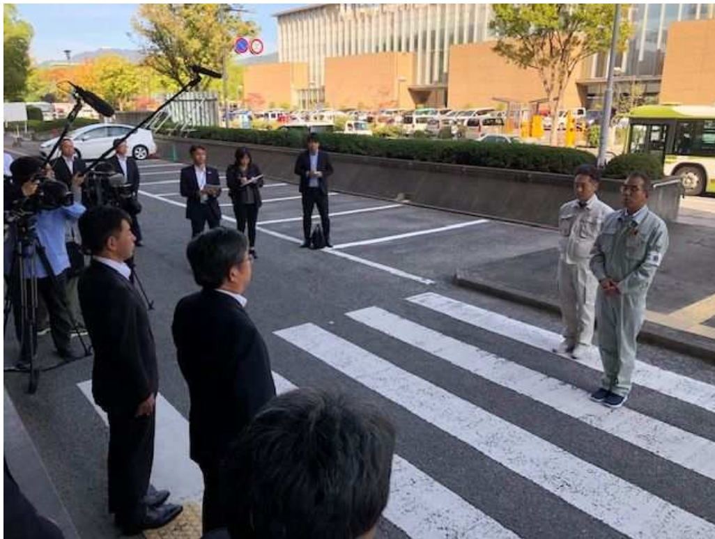
令和元年台風15号の被害に係る千葉県への派遣出発式の様子