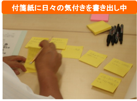
付箋紙に日々の気づきを書き出し中

今後は、「熟議」で出されたアイデアを整理し、どの改善策に、どの程度着手するかを校長が意思決定し、できることから改善策を具体化・実施する予定です！