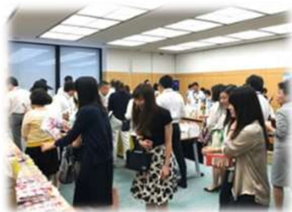
物産展の様子<日比谷本社>