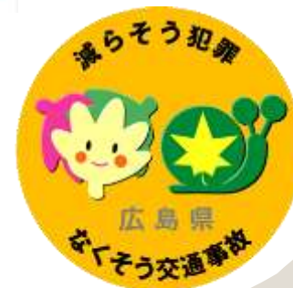
減らそう犯罪・なくそう交通事故 パートナーシップシンボルマーク