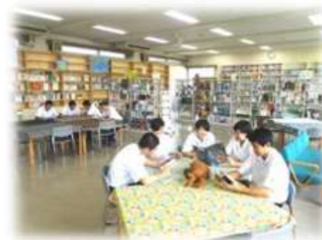
リニューアルした図書館