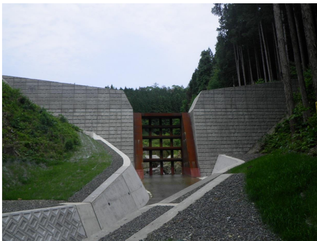
砂防指定地内河川 便坂川 三次市作木町上作木