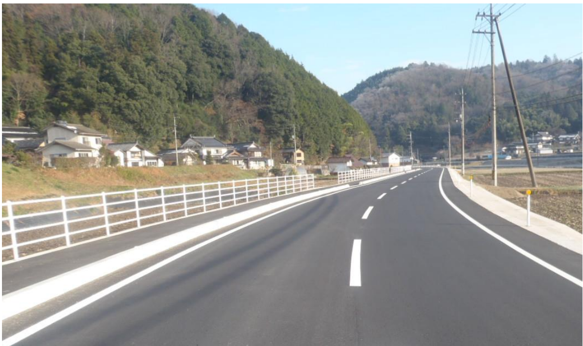
主要地方道 甲山甲奴上市線 三次市甲奴町小童