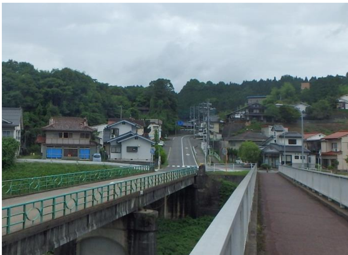
都市計画道路 巴橋栗屋線 三次市栗屋町