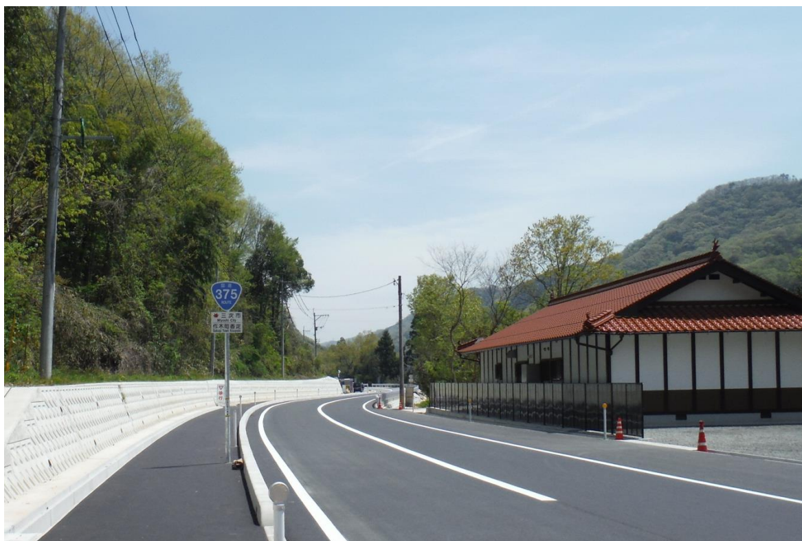
一般国道 375号 三次市作木町香淀