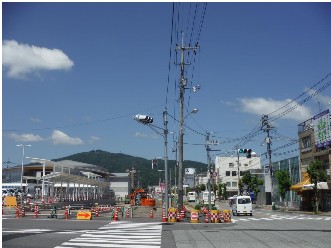
一般国道 183号 三次市十日市中～十日市東