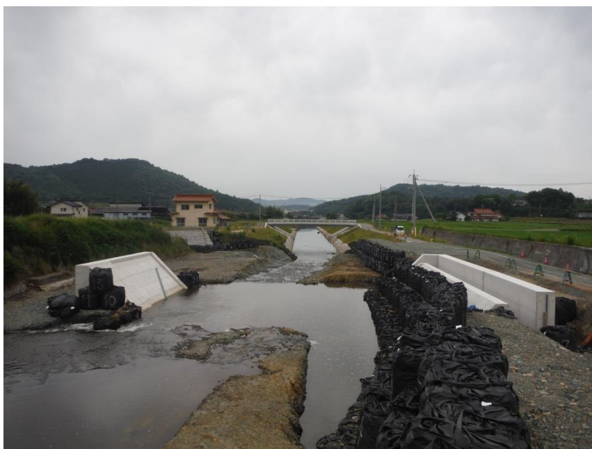
一級河川江の川水系 国兼川 三次市和知町