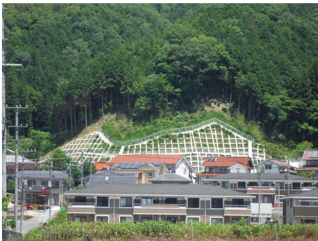
三次市三次町 寺戸地区