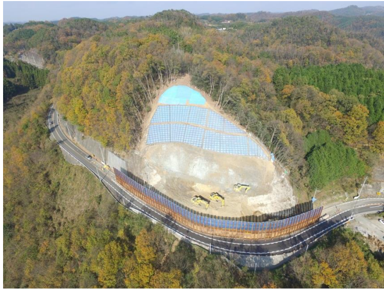
⑤2車線供用開始後（平成27年12月25日撮影）