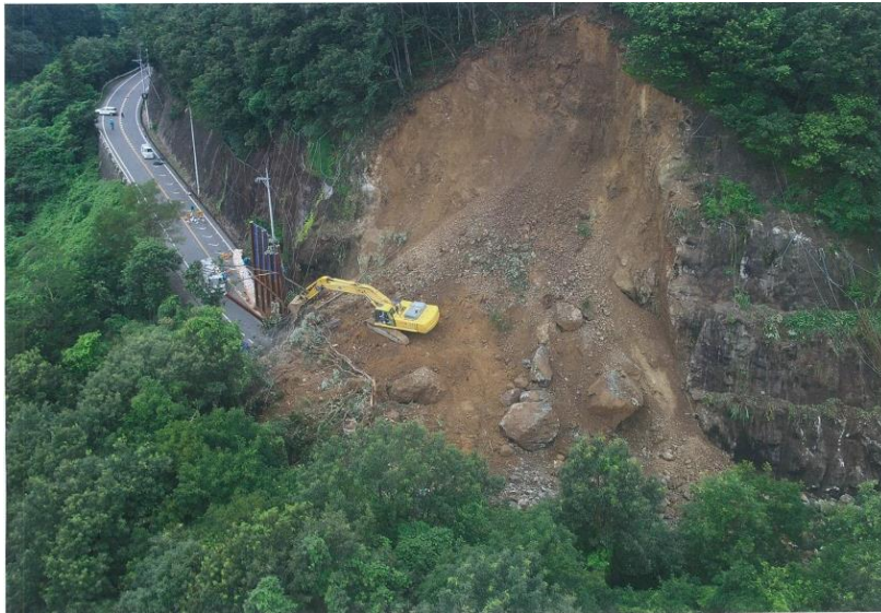
② 暫定交通開放後（平成 27 年 8 月 18 日撮影）