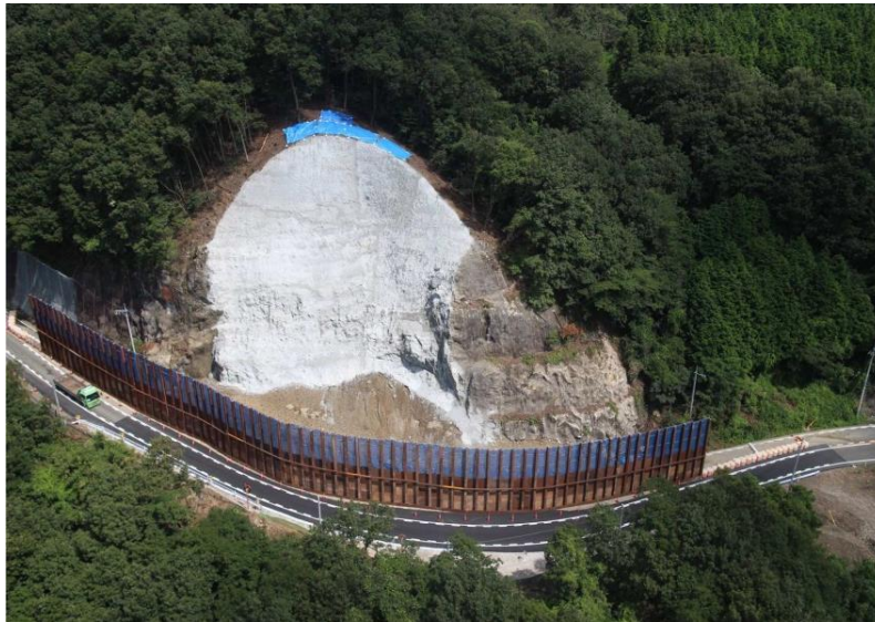
③ 復旧工事進捗状況（平成 27 年 11 月 2 日撮影）