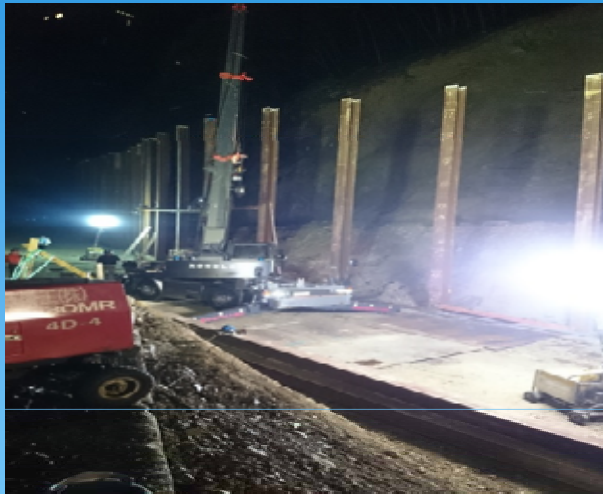
7月31日 夜間作業にて、仮設防護柵建込開始。