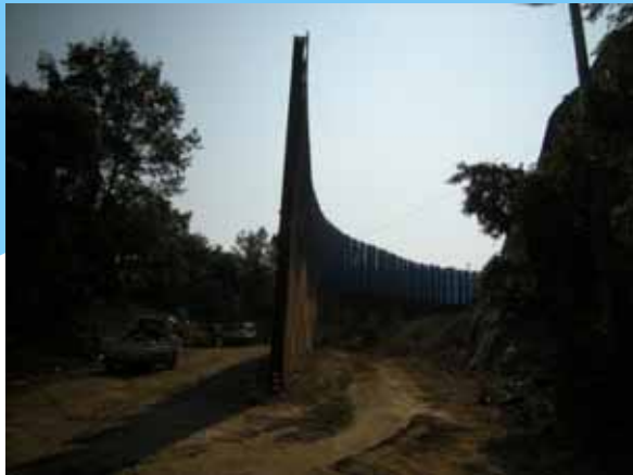
3日 仮設防護柵 延長111m設置完了。