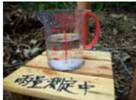
現場簡易雨量観測