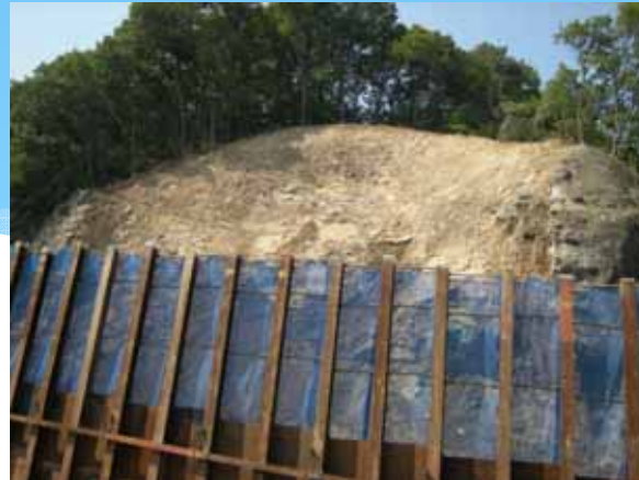
4日 崩壊斜面の不安定土塊除去完了。