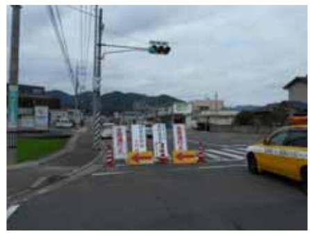
全面通行止時の規制案内状況 福山市加茂町中野地内 (主)加茂油木線交差