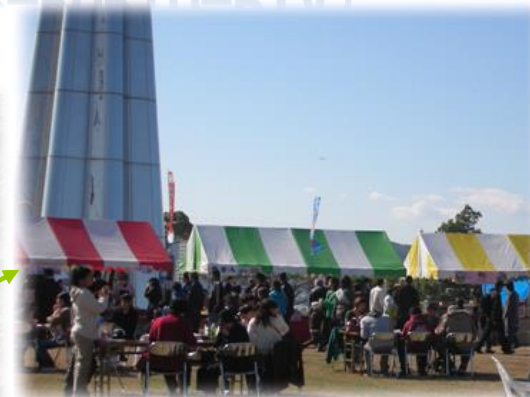
宇品波止場公園 コンテナ置場は波止場公園として整備され、県民の憩いの場として、また客船の歓迎イベント等の会場として活用されて