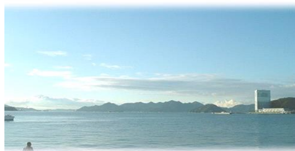
現地からの眺望 前面には広島湾が広がり、瀬戸の多島美やリゾートホテルなどの眺望を楽しむことができます。