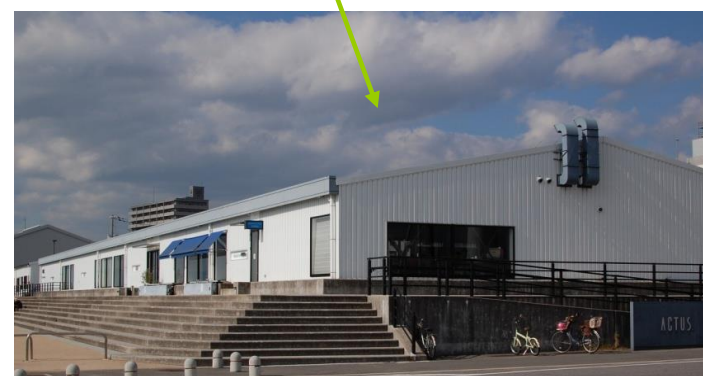
5号上屋 ACTUS広島店 インテリアショップ及びカフェ 平成17年12月オープン