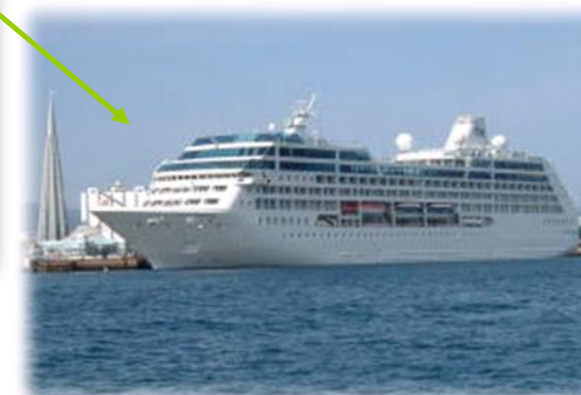
観光船心頭 荷役に使用されていた岸壁は、現在、観光船心頭として使用されています。年間30隻程度のクルーズ船が寄港する、全国でも有数の施設となっています。