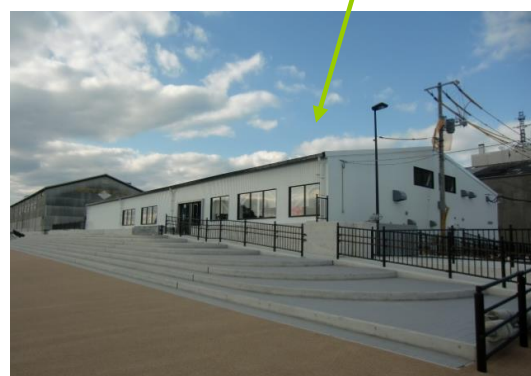
4号上屋 ACTUS広島店 インテリアショップ、ベーカリーショップ及びサイクルショップ 平成23年11月 オープン