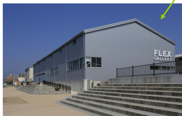
3号上屋 FLEX GALLERY インテリア・雑貨ショップ、レストラン