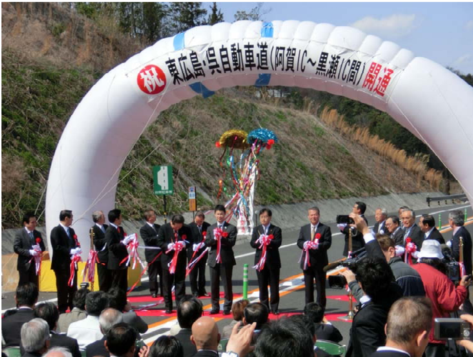
東広島・呉自動車道（黒瀬IC～阿賀IC）開通式 （呉市・東広島市）