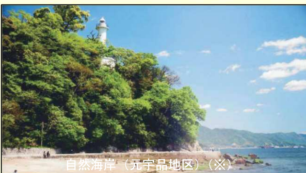
自然海岸（元宇品地区）（※）