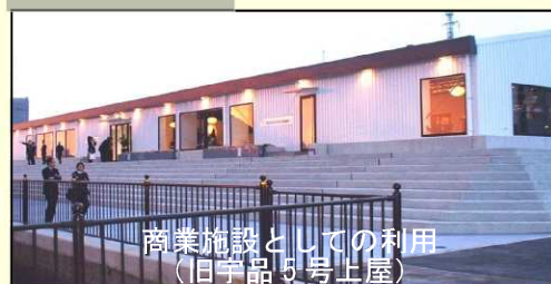
商業施設としての利用 （旧宇品5号上屋）