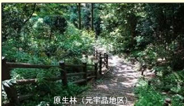
原生林（元宇品地区）