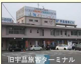
旧宇品旅客ターミナル