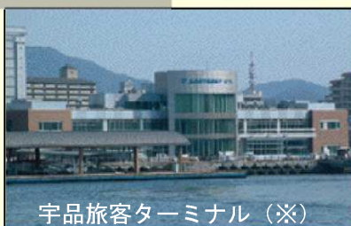
宇品旅客ターミナル（※）