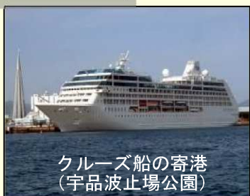
クルーズ船の寄港 （宇品波止場公園）