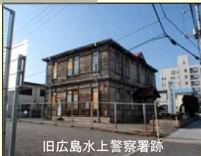
旧広島水上警察署跡