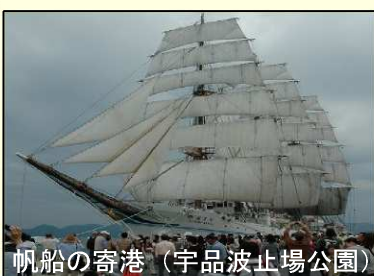
帆船の寄港（宇品波止場公園）