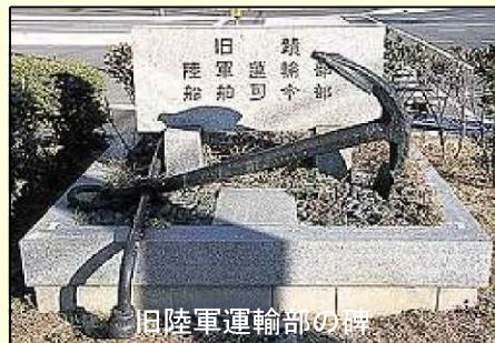
旧陸軍運輸部の碑