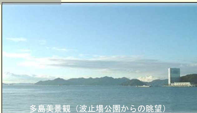
多島美景観（波止場公園からの眺望）