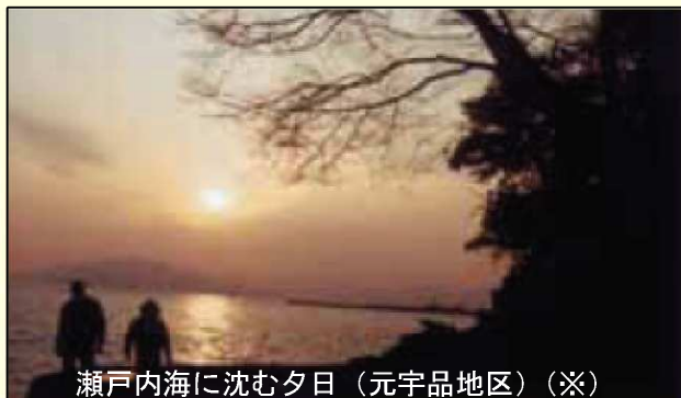
瀬戸内海に沈む夕日（元宇品地区）（※）