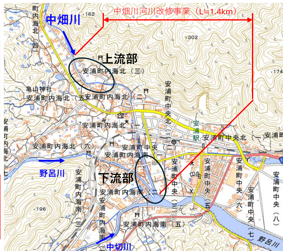
国土地理院地図に広島県が加筆