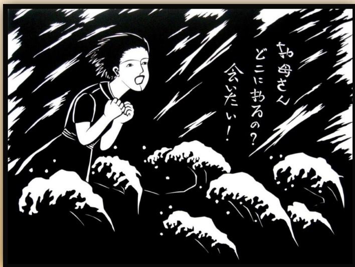
岩井梅子（中国帰国者）作 切り絵 「お母さん、会いたい！」