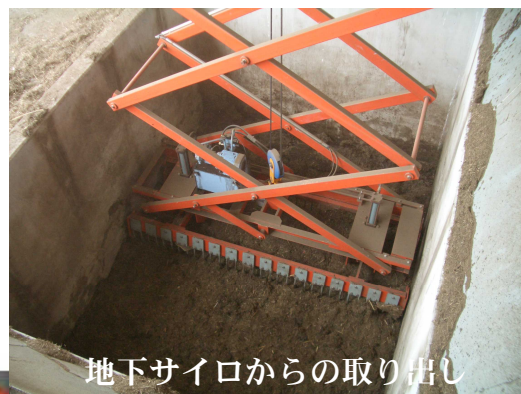
地下サイロからの取り出し