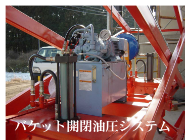
バケット開閉油圧システム