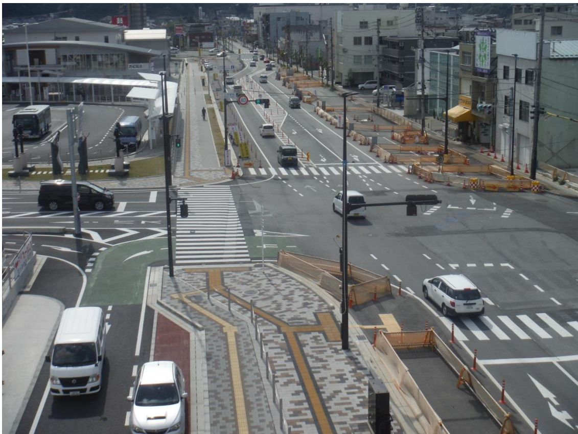
一般国道 183号 三次市十日市中～十日市東