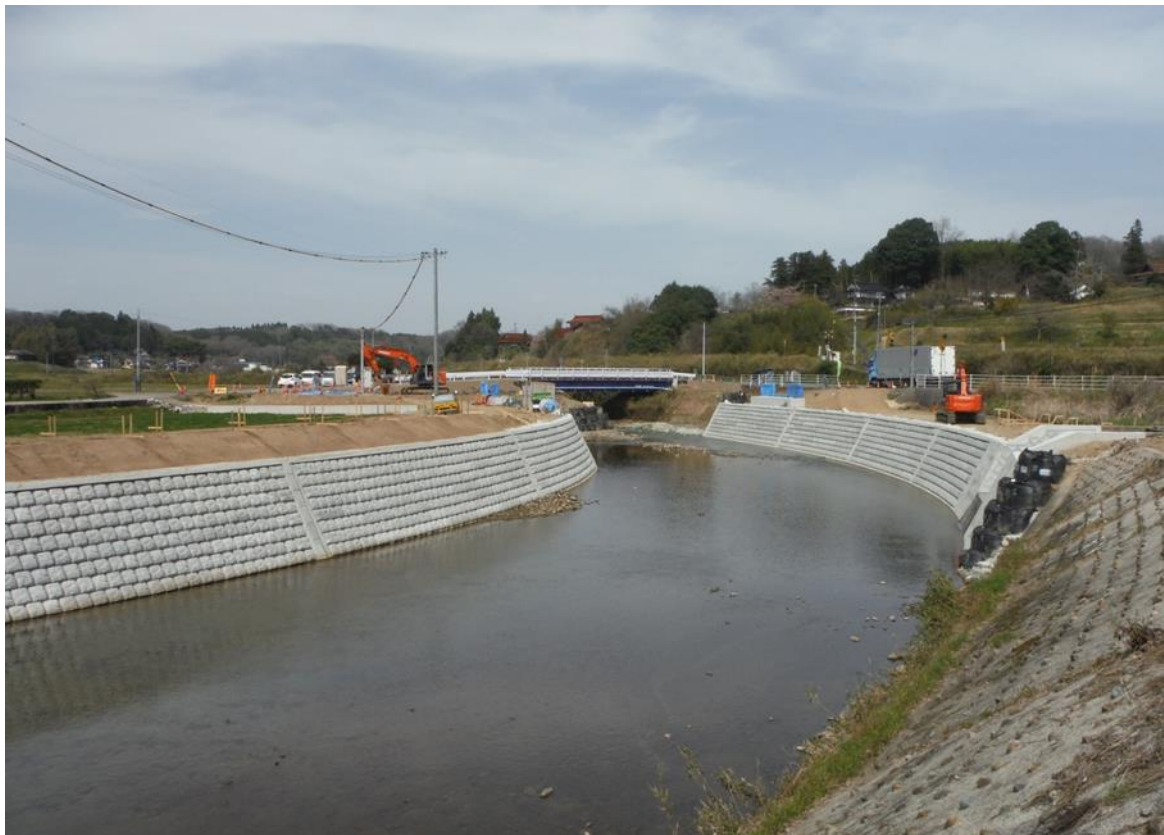
一級河川江の川水系 国兼川 三次市和知町