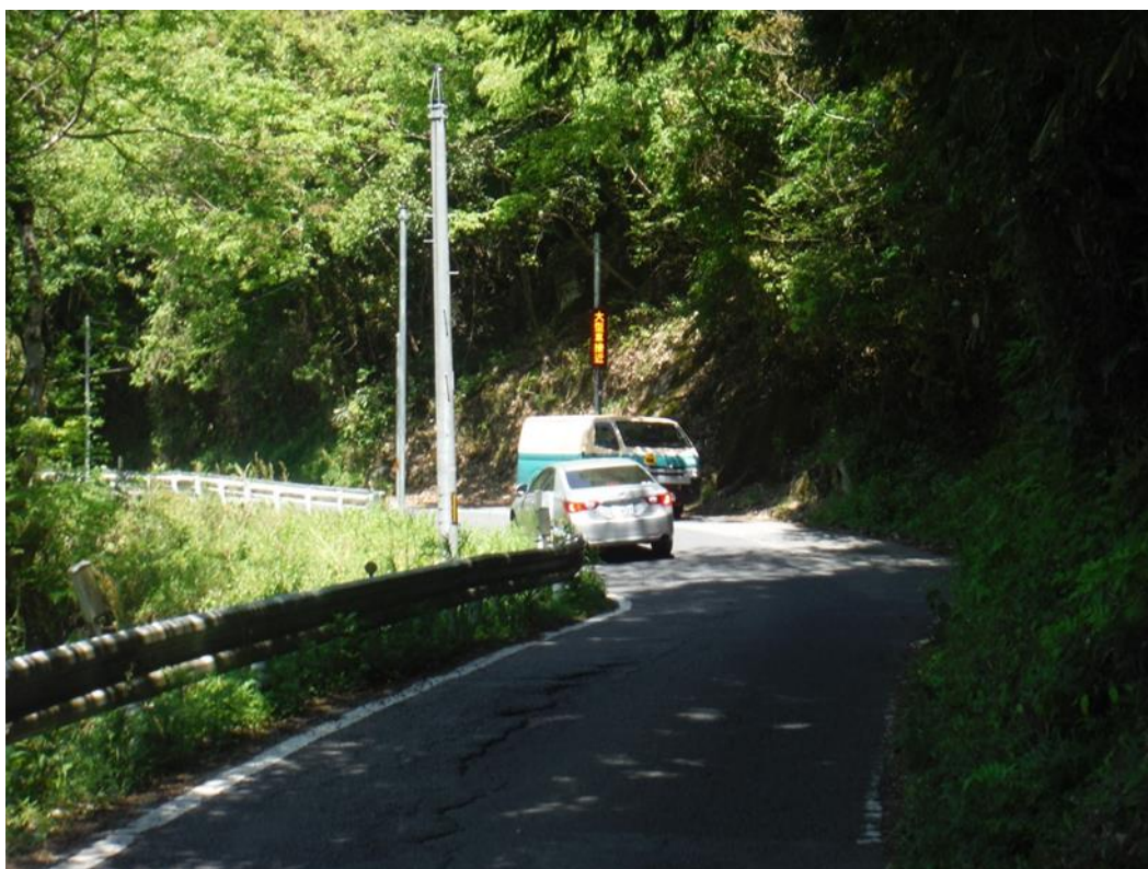
一般国道 375号 三次市日下町