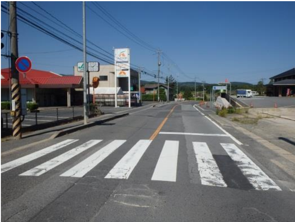
主要地方道 世羅甲田線 三次市三和町 上板木