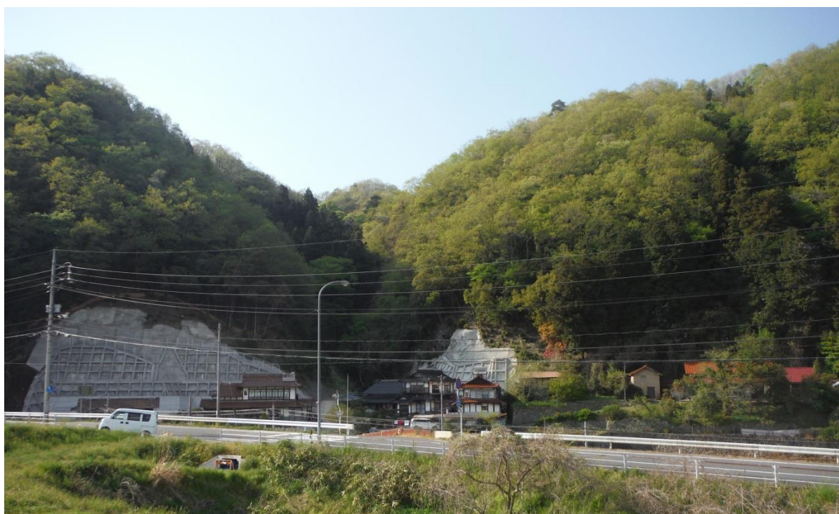
三次市三次町 山田地区