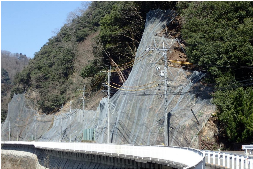
一般国道375号 作木町芝坂 法面防災工事

山地部の多い管内の実態から特に道路交通の安全確保を図るため、落石等危険箇所の総点検を行い、緊急度の高い所から整備を行っており、今年度は、一般国道375号日下、主要地方道吉舎豊栄線等の落石防護網、一般国道375号有原の落石防護補強土擁壁を実施する。