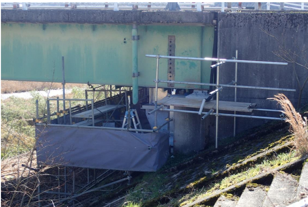
一般国道375号 三次市粟屋町 日山橋耐震工事

今年度は、一般国道375号日山橋において耐震補強のための工事や、主要地方道広島三次線の落合橋外の設計を実施する。