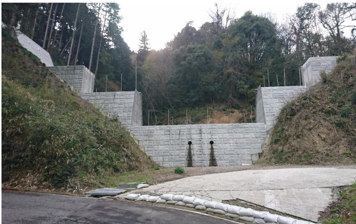
砂防指定地内河川 中の村川4号 三次市粟屋町中ノ村