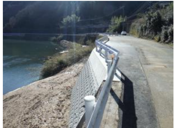
一般県道 三次江津線 三次市栗屋町長谷 (左：被災状況, 右：完成)