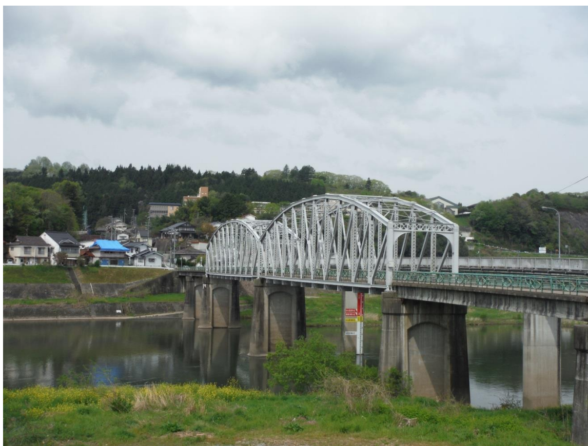
都市計画道路 巴橋栗屋線 三次市栗屋町