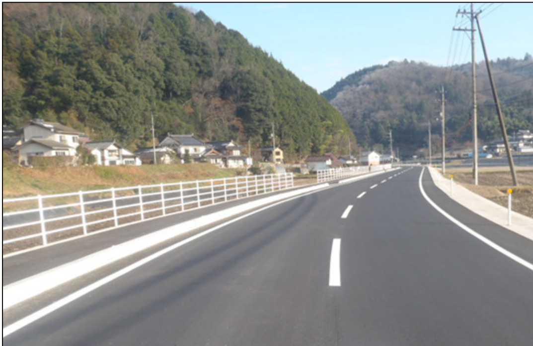
主要地方道 甲山甲奴上市線 三次市甲奴町小童