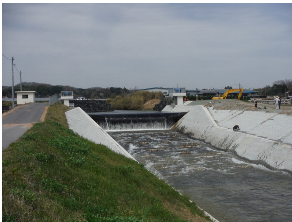
一級河川江の川水系 国兼川 三次市和知町