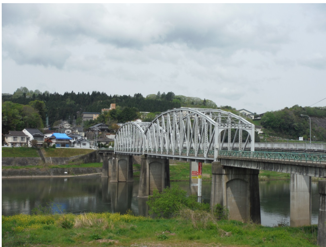
都市計画道路 巴橋栗屋線 三次市栗屋町