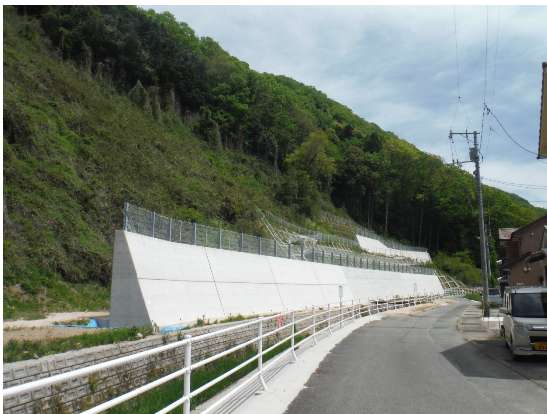
三次市畠敷町 畠敷地区