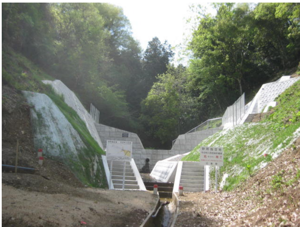
砂防指定地内河川 中の村川4号 三次市粟屋町中ノ村