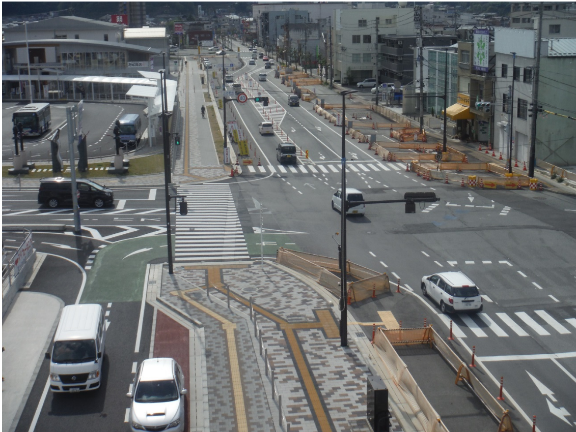
一般国道 183号 三次市十日市中～十日市東