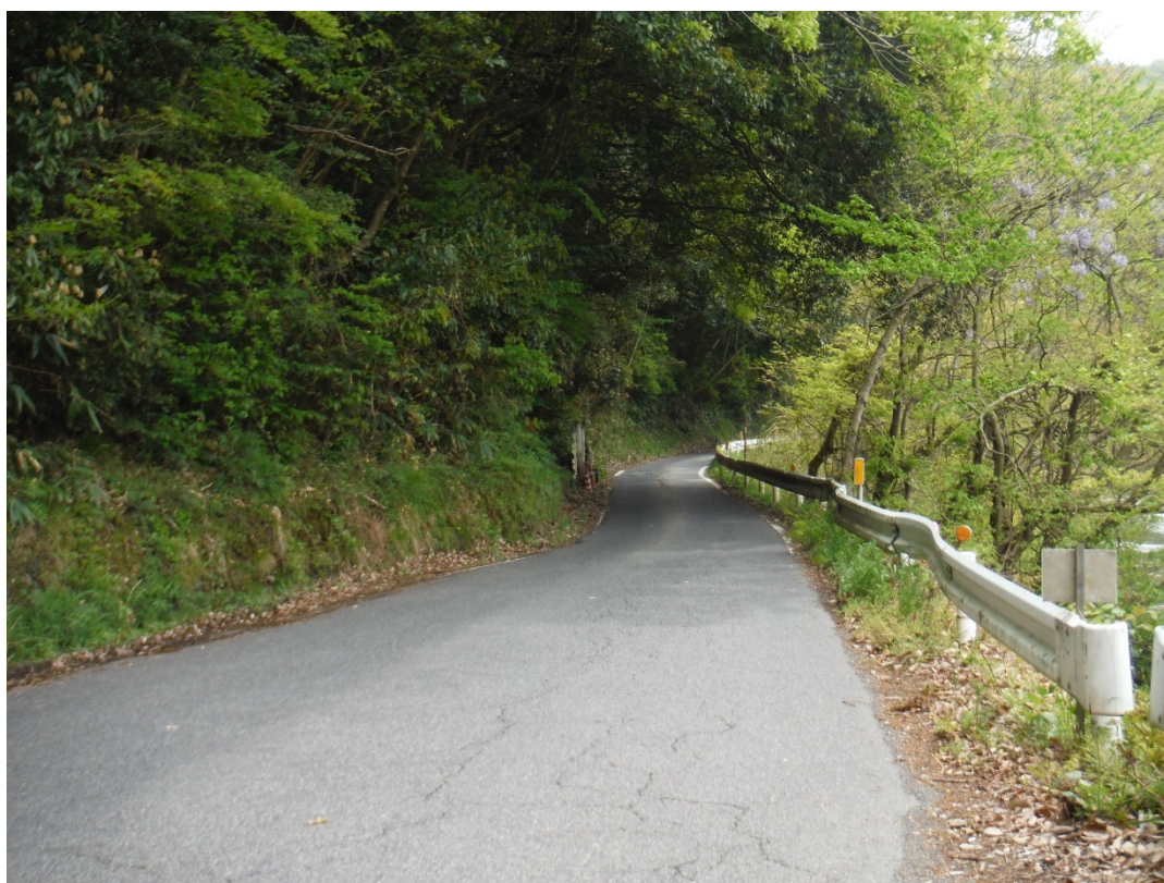
一般国道 375号 三次市日下町