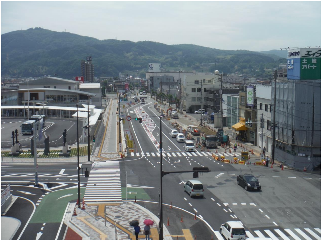
一般国道 183号 三次市十日市中～十日市東