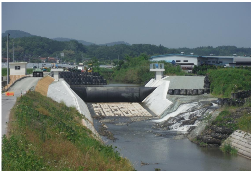
一級河川江の川水系 国兼川 三次市和知町