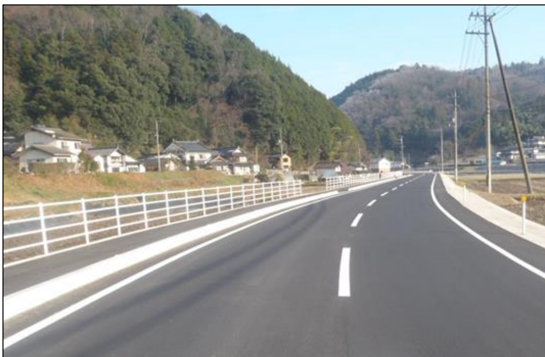
主要地方道 甲山甲奴上市線 三次市甲奴町小童

一般国道375号 三次市十日市中 一般国道375号 三次市三和町敷名 一般国道375号 三次市十日市南 一般国道183号 三次市四拾貫町 主要地方道甲山甲奴上市線 三次市甲奴町福田 主要地方道世羅甲田線 三次市三和町上板木 主要地方道庄原作木線 三次市君田町石原