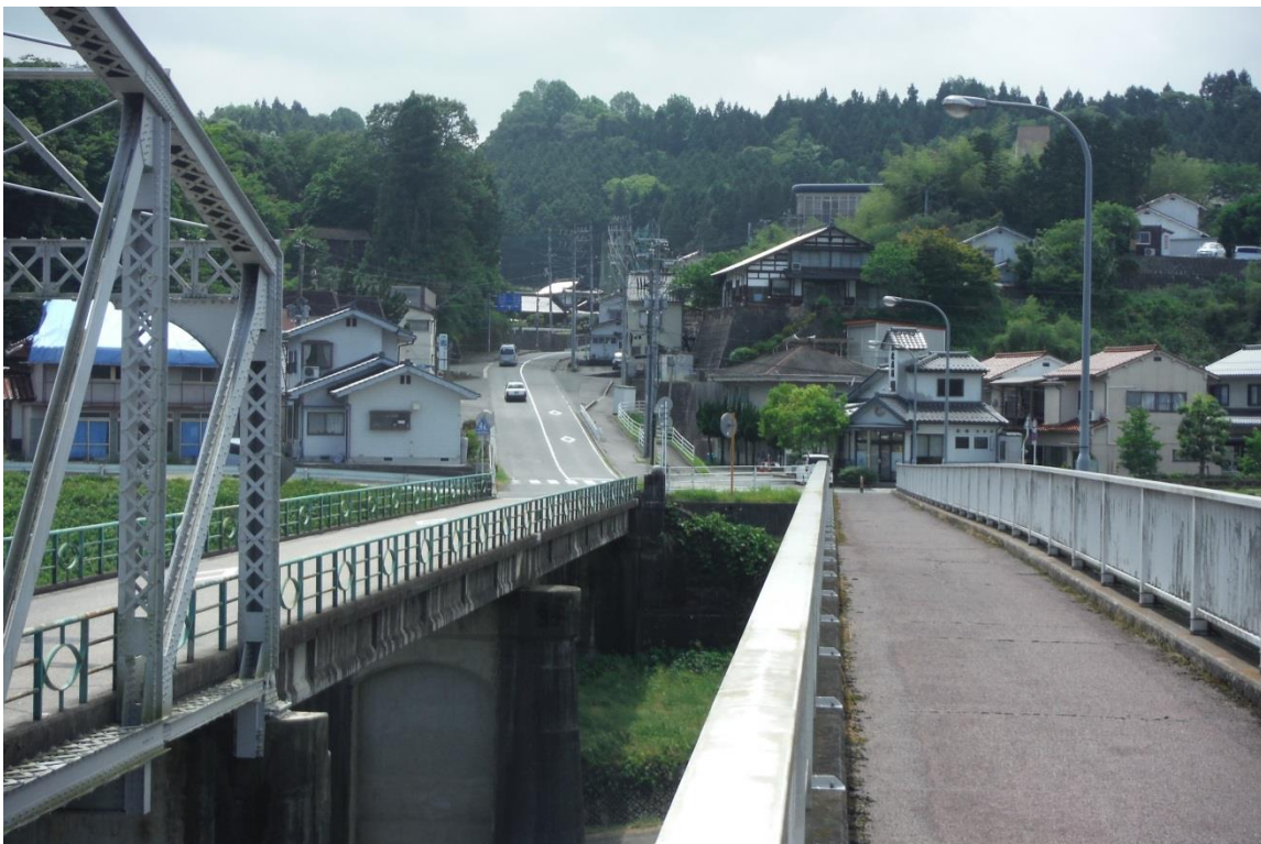
都市計画道路 巴橋栗屋線 三次市栗屋町