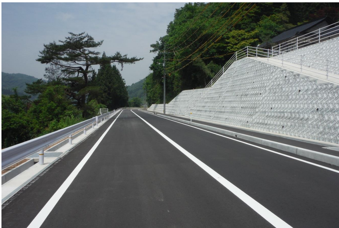
一般国道 375号 三次市作木町香淀