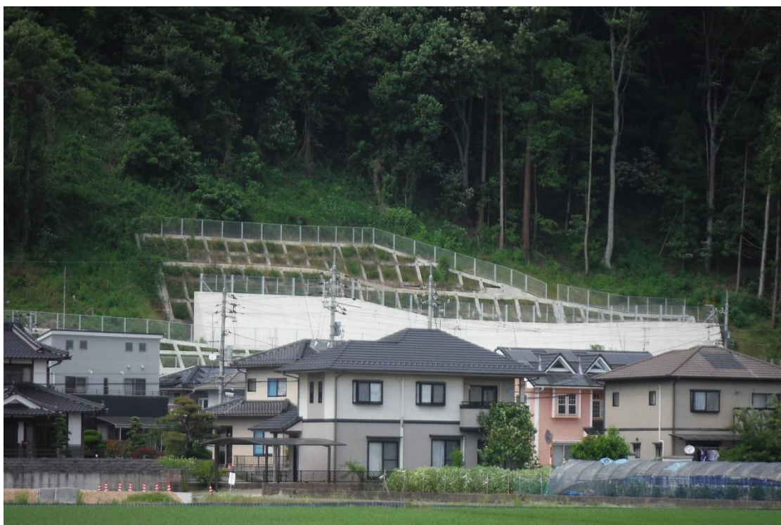
三次市畠敷町 畠敷地区