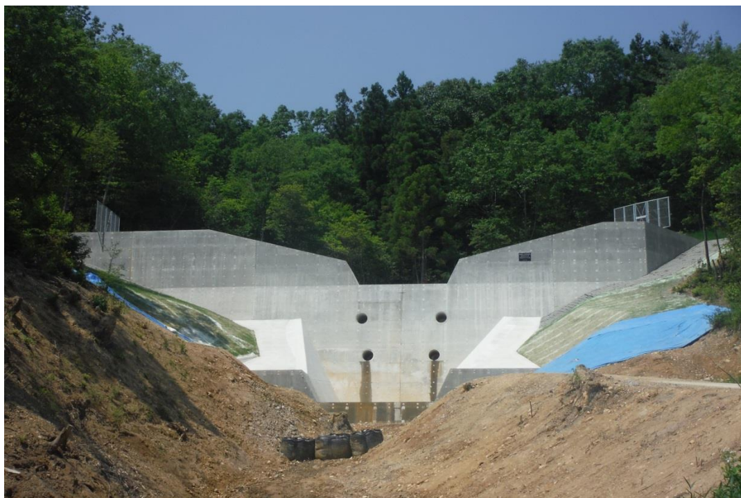
砂防指定地内河川 日南川 三次市三良坂町三良坂