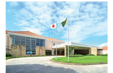
瀬戸内ゴルフリゾート