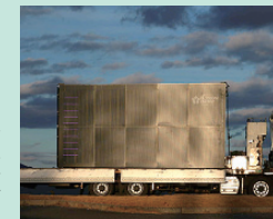
瀬戸内ゴルフリゾートに設置されたボイラ初号機

5月に広島県の「新たな価値づくり研究開発支援補助金」に採択され、大型化に着手。「瀬戸内ゴルフリゾート」という実証フィールドを得て、12月、国内初の商用ボイラ初号機が完成。2026年3月、蓄熱システムによるお風呂への給湯実証を開始。