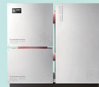
最初に開発した小規模な試作機

スタートアップ企業と竹原市内の事業者が協働し、産業振興につながるイノベーション創出を目指すアクセラレーションプログラム「たけはらDX」に採択。試作機の開発に着手し、蓄熱の原理が計算通りに機能することを確認した。