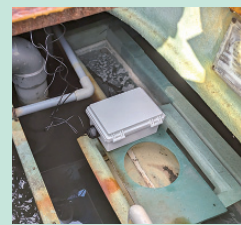
浄化槽内に設置した水質センサー

DXに積極的な株式会社太 陽都市クリーナー(府中市) が協業に手を上げ、実証実 験をスタート。数力所の浄 化槽内にIoT水質センサー を設置し、経過を観測。