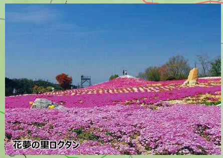
花夢の里ロクタン