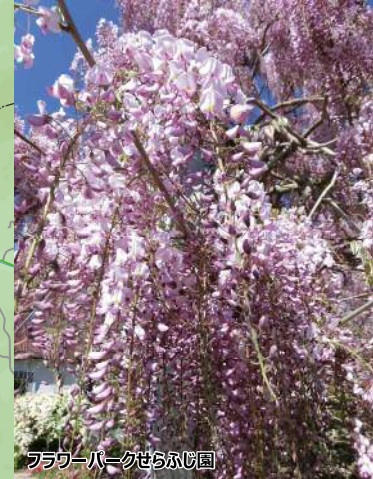
フラワーパークせらふじ園