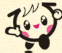
広島県の子ども元氣いっぱいキャラクター イクちゃん

アンケート結果を見ると、子育ての相談ができる「子育てサポートステーション」や、県内約3,300か所に設置した授乳・オムツ替えができる「イクちゃんベビールーム」、子ども用トイレなど。これからも「子育てするなら広島県で！」を目指し、パパママが安心して子育てできる環境づくりを地域ぐるみで進めていきます。