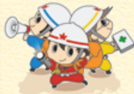
広島県の防災キャラクター 「タスケ三兄弟」

アンケート結果を見ると、県民の災害に対する備えがまだ十分にできていないことが伺えます。今年4月に、淡路島を震源地とする近畿・中四国にまたがる地震が発生しました。広島県への影響は大きくなく、かつたものの、大地震はいつ発生するかわかりません。地震の時に、身を守るためには、日頃からの備えが大切です。県では9月4日に「一斉防災訓練」を実施します。この訓練をきっかけに、家族で防災について話し合ってみましょう。