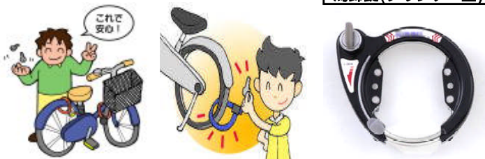
馬蹄錠(シリンダー型)

また、盗難被害者の21.8%は高校生で、次いで12.2%が中学生、11.3%が大学生となっており、被害に遭った自転車のうち半数以上は施錠されておらず、施錠されていてもプレス錠のみでは、簡単に開錠されて被害に遭っています。