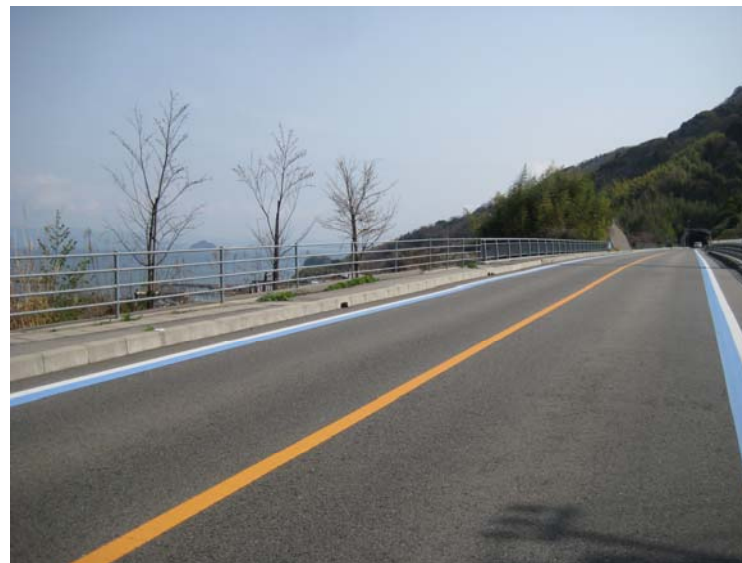
写真4 上蒲刈島（呉市蒲刈町）