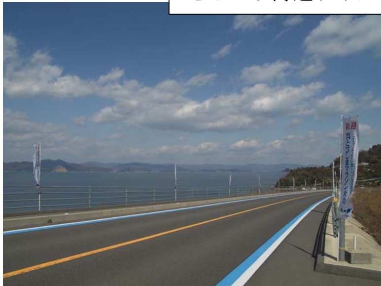
写真1 豊島（呉市豊浜町）