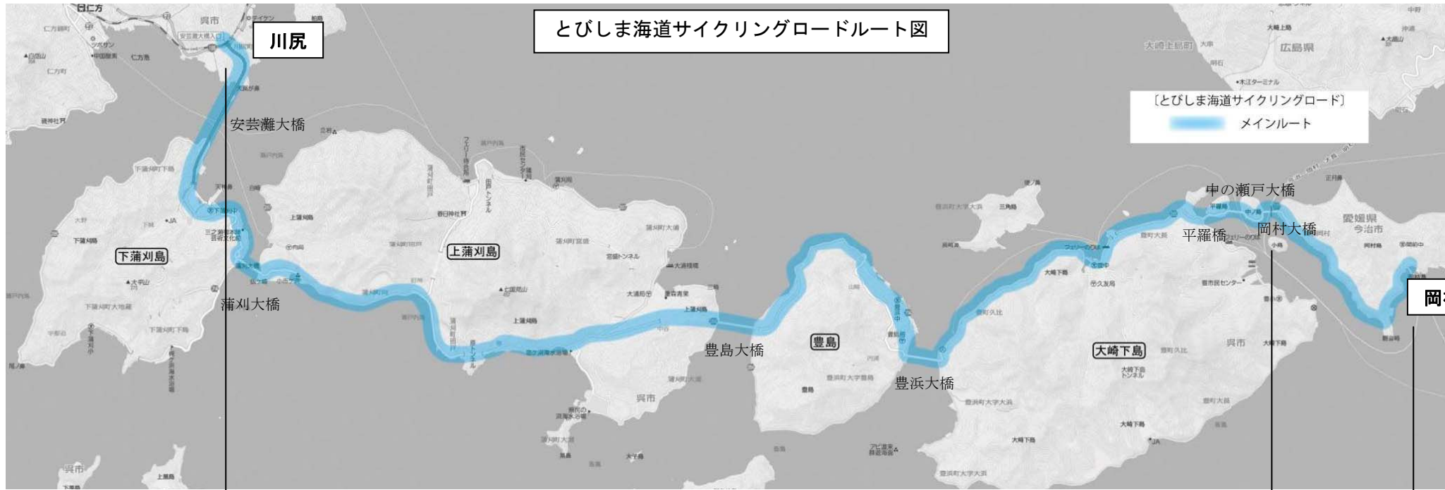
とびしま海道サイクリングロードルート図