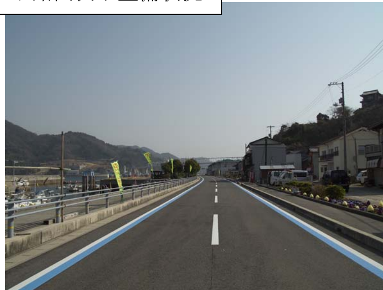
写真2 豊島（呉市豊浜町）