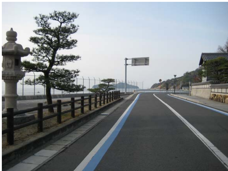
写真3 下蒲刈島（呉市下蒲刈町）