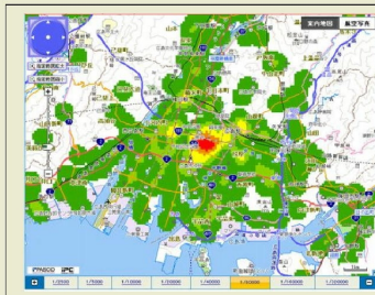
←犯罪発生マップ (密度分布表示)