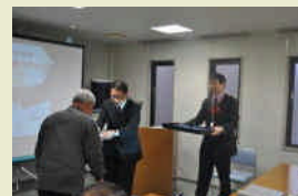
北部会場の様子 (受講風景、修了証の交付)

今後は、地域の安全・安心なまちづくりの地域活動リーダーとして、活躍が期待されます。