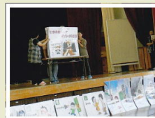
「いかのおすし」の紙芝居

防犯教室にはついて行きません。」などの声も聞かれ好評でした。 今後も「八幡パイロット」の活躍が大いに期待されます。頑張ってください。