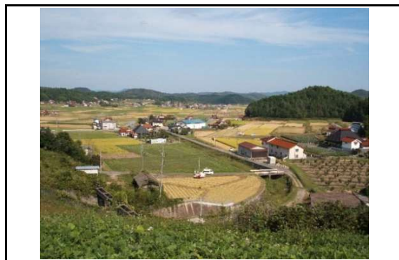
自然豊かな中国山地でお米が作られています