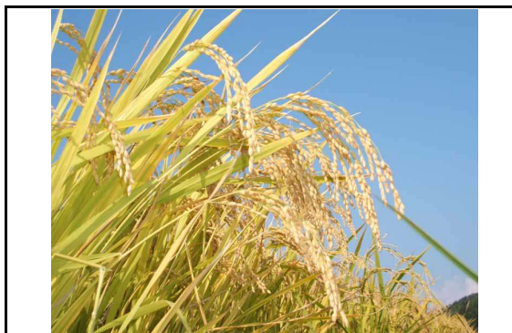
収穫を迎えた稲穂