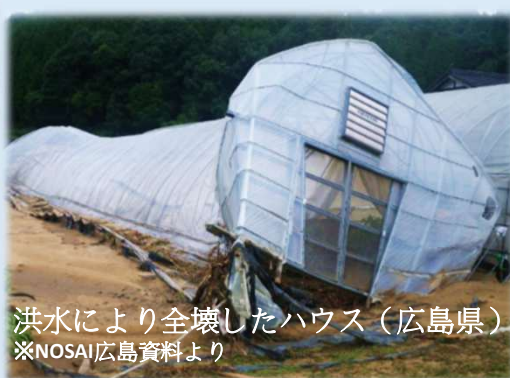
洪水により全壊したハウス(広島県) ※NOSAI広島資料より