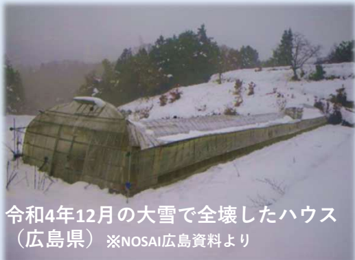
令和4年12月の大雪で全壊したハウス (広島県)