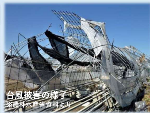
台風被害の様子 ※農林水産省資料より