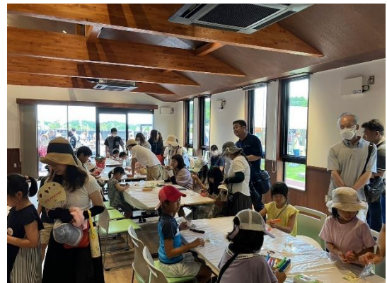
<イベント開催中の様子>