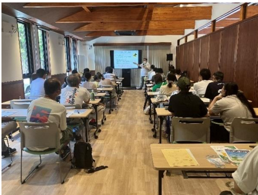
<譲渡前講習会の様子>