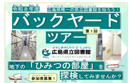
(バックヤードツアー)