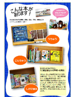
(サイエンスライブラリー)