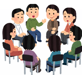
ワークショップの開催