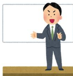
講師の謝金・旅費