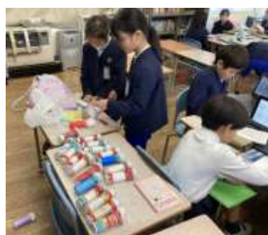
第一小学校の児童が協働している場面