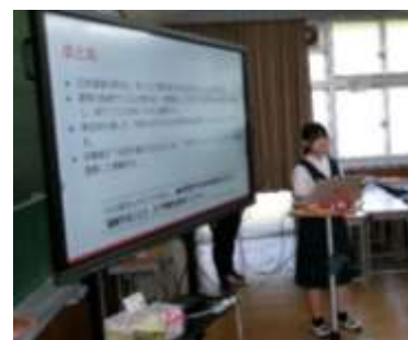
探究したことを地域の方に発表している場面

「この旋律は、どこから生まれたのだろう。」楽譜を読み解く中で生まれた疑問が、吹奏楽パートの探究の出発点でした。調べていくうちに、熊野に古くから伝わる麦打ち唄が組曲に取り入れられていることが分かりました。地域の歴史や人々の暮らしに目を向ける中で、音楽が営みと結びついていることに気付きます。「意味を知らずに演奏していてよいのだろうか。」生徒たちはリズムや構造の理由を考え、自分のパートの役割や他パートとの重なりを見つめ直しました。すると、正確に演奏すること以上に、地域の情景や願いを音で語ることの大切さが見えてきました。生徒たちは旋律に込められた記憶をたどりながら、自分たちの音で物語を紡ごうとしています。