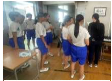
神楽踊りと組曲の音の関連性を確認している場面

「組曲の踊りって、何を伝えようとしているの？」ある生徒の素朴な疑問から、踊りパートの探究が始まりました。それまで、楽しさや上達を目標に、先輩の振付をなぞることばかりに懸命になっていた生徒たち。「知りたい」という想いを原動力に、タブレットや図書室の資料を活用し調べ始めました。そして、元郷土資料館館長さんに話を聞きたいと動き出しました。すると、熊野町に450年以上前から伝わる神楽踊りと組曲の音に関連性があることや、筆産業が盛んになる前は農業が中心だった歴史的背景が見えてきました。「筆のイメージだけでなく、大地の恵みへの感謝も込められているんじゃないか。」生徒たちは自分たちなりの解釈を見つけ、踊りに新たな魂を吹き込んでいきました。