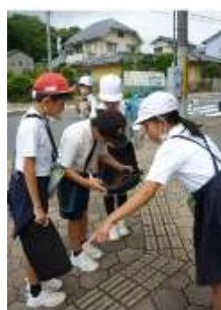
第三小学校の児童がフィールドワークしている場面