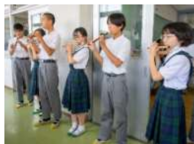
篠笛とリコーダーを同時に吹き音色を確かめている場面

「篠笛は、組曲の中でどんな役割を担っているのだろう。」その問いから、探究が始まりました。進んで取り組む生徒がいる一方で、戸惑いを感じていた生徒もいます。その違いがあったからこそ、「自分たちは何を担っているのか」を確かめたいという思いが生まれました。「ほかの楽器で代えられないのだろうか。」と問いを立てたグループは実際にリコーダーでの演奏を試し、響きの違いを比べました。さらに、地域の方への聞き取りや資料調査を通して、神楽を源流とする和の響きが組曲の世界観と結びついていることに気付きました。「本物の音を知りたい」と講師を自分たちで探し、来校を依頼したグループもありました。また、「音が小さい」という課題には、立ち位置や見せ方を工夫することで応えようとしていました。問い続ける中で、生徒たちは「篠笛だからこそ担えるものがある」と実感していきました。生徒たちは篠笛の存在意義を自分たちの言葉で確かめ、その表現を未来へつなごうとしています。