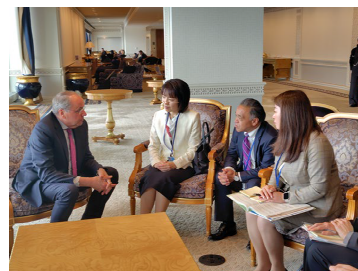
【ゲーベル大使との面会】

県/HOPeが進める研究、人材育成等について説明し、賛同を得た。大使からは、ドイツはNATOの一員として、安全保障上の脅威や圧力に直面しているとの現状説明の後、長期的には軍縮に向けた道筋を模索していく必要があること、科学技術が進展する中で、安全保障と倫理が両立する立場を取っていく必要があるとの認識が示された。