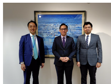
【カリム次席常駐代表との面会】

県/HOPeが進める研究、人材育成等について説明し、賛同を得た。大使からは、マレーシアは核軍縮ではなく、核廃絶の実現を目指しており、ASEAN加盟国全体としても同じ覚悟を持ち、核廃絶に向けて進むとの認識が示された。また、人材育成についてマレーシアの若者も参加させてほしい旨の要望が示された。