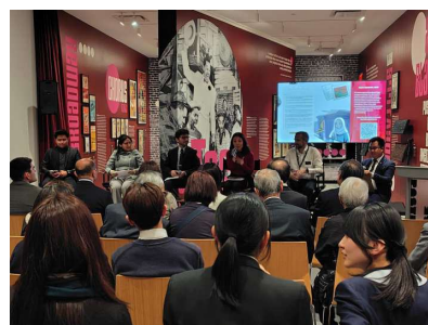
【パネル・ディスカッションの様子】

また、本レセプションでは、日本政府が拠出している「ユース非核リーダー基金 (YLF)」プログラムの卒業生や参加者が中心となったパネル・ディスカッションも行われ、出席者の間での活発な意見交換が行われた。