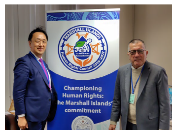
【シルク大使との面会】

持続可能性の観点から核兵器廃絶を進める取組について説明し、賛同を得た。大使からは、核実験により、国民の健康状況や食料供給等の経済・環境面で大きな被害が生じており、核兵器が持続可能性を損なうことは経験的にも理解するとの認識が示された。