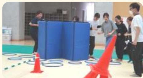
チームでジャングル鬼ごっこの環境づくり