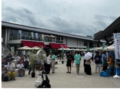
ローンチイベント