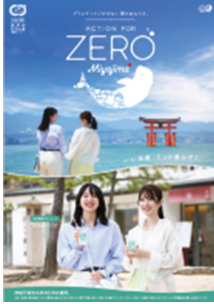
メインポスター (店頭や電車の中刷り)