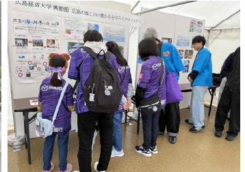
試合日の啓発イベント