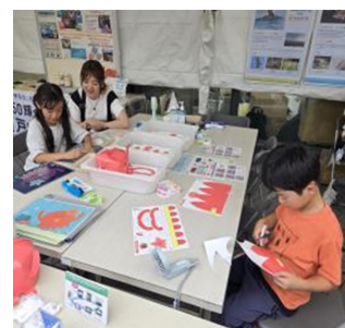
GSHIP イメージキャラクターを模した帽子工作体験