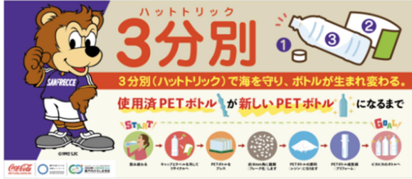
スタジアム内の啓発パネル