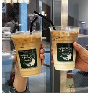
生分解性素材のカップ・ホテルアメニティ