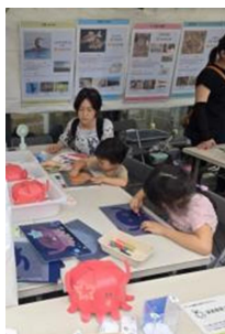
繰り返し使える黒板シートを使ったぬり絵体験