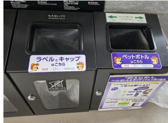
スタジアム内の分別BOX