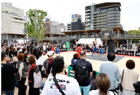
3×3バスケットボール