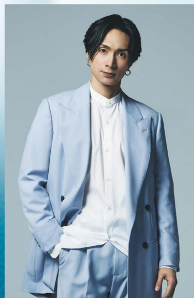
広報アンバサダー 橘ケンチ (EXILE/EXILE THE SECOND)