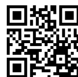
令和7年度研修の動画