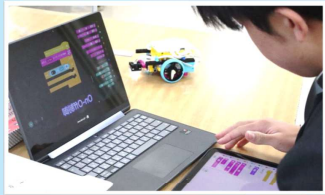
自動運転のしくみを プログラミングで体験