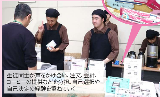
生徒同士が声をかけ合い、注文、会計、 コーヒーの提供などを分担。自己選択や 自己決定の経験を重ねていく