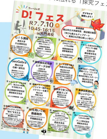
[ 県立大門高等学校 ]