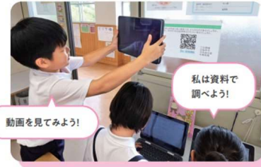
動画を見てみよう!