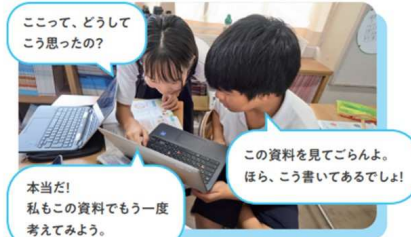
ここで、どうして こう思ったの?