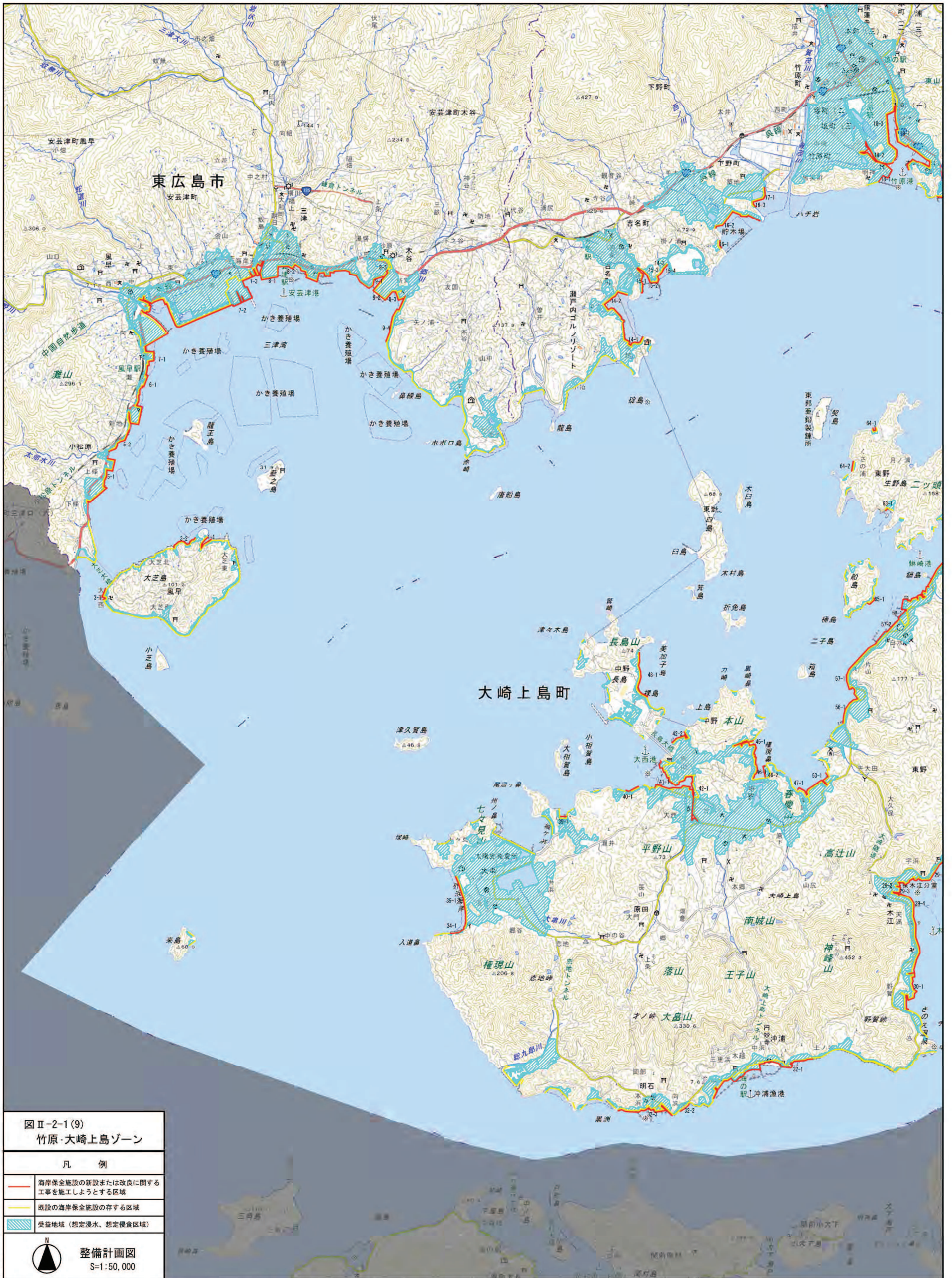
図Ⅱ-2-1(9) 竹原・大崎上島ゾーン