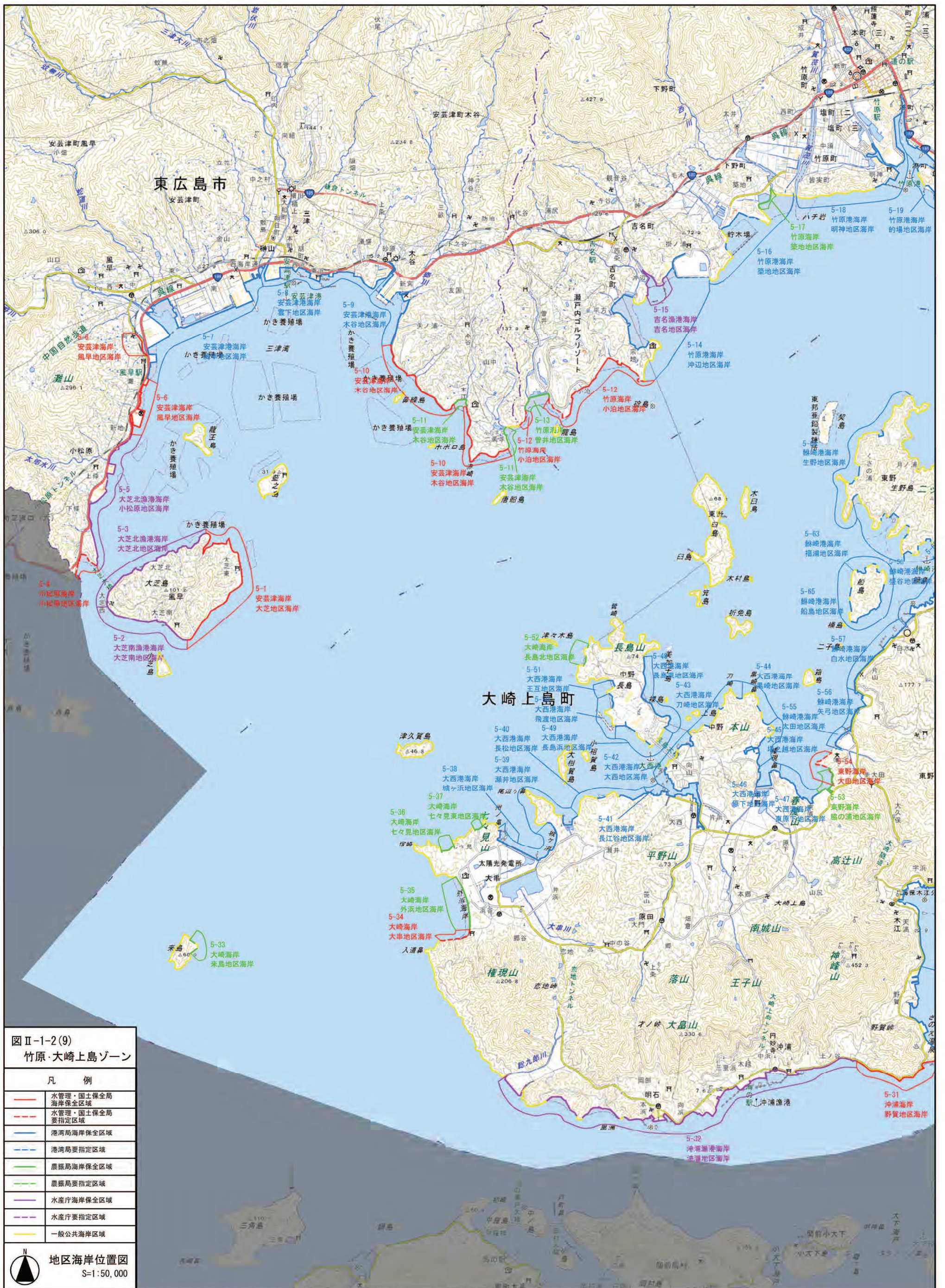
図Ⅱ-1-2(9) 竹原・大崎上島ゾーン