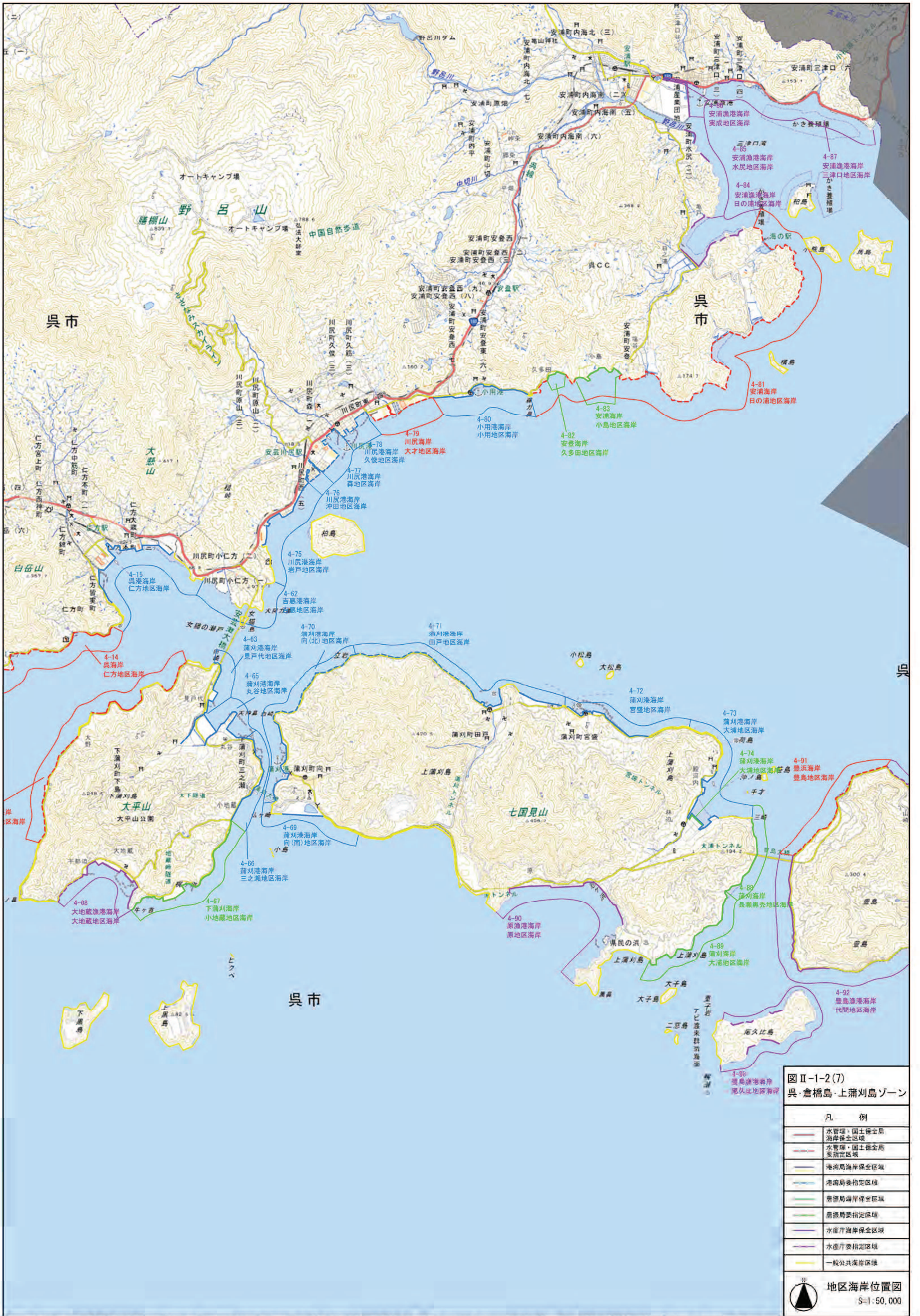
図II-1-2(7) 奥・倉橋島・上蒲刈島ゾーン